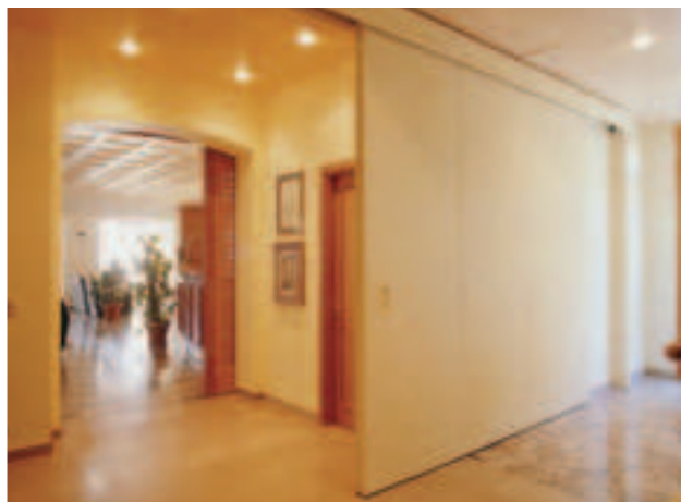
Porta scorrevole REI 120 ad un'anta