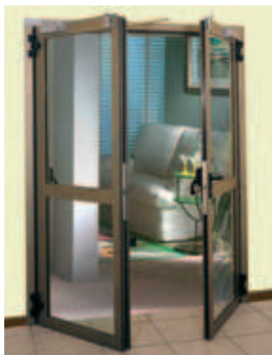
Porta vetrata REI 120 "Alusthal"