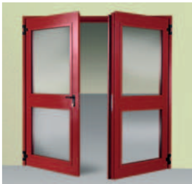
Porta vetrata REI 60 o REI 120 "NOVOGLASS E" a due battenti