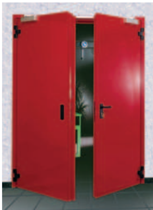
Porte "Elite" REI 60 a due battenti

i PER ORDINI indicare Articolo e specificare il senso di apertura