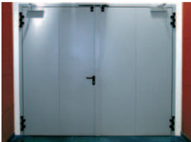
Porta di grandi dimensioni a due ante