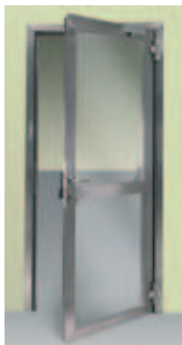
Porta vetrata REI 60 "StahlGlass" in acciaio inox satinato