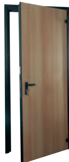
Porta "Elite" REI 120 rivestita in laminato plastico (effetto legno)

i PER ORDINI indicare Articolo e specificare il senso di apertura